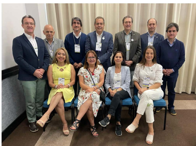
Autorités de l'ALAPE et de la FOSPECS.