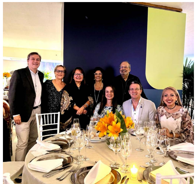
SBP Fermeture du congrès