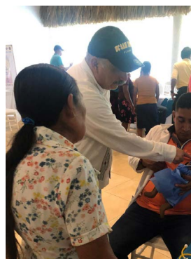
Una enfermera local durante el taller AAP ENC1 en Palenque, Chiapas.

En junio de 2024, la AAP visitó Surinam para facilitar talleres de desarrollo de capacidades de la sociedad pediátrica con Vereniging Kinderartsen Suriname (VKS - Asociación de Pediatras de Surinam).