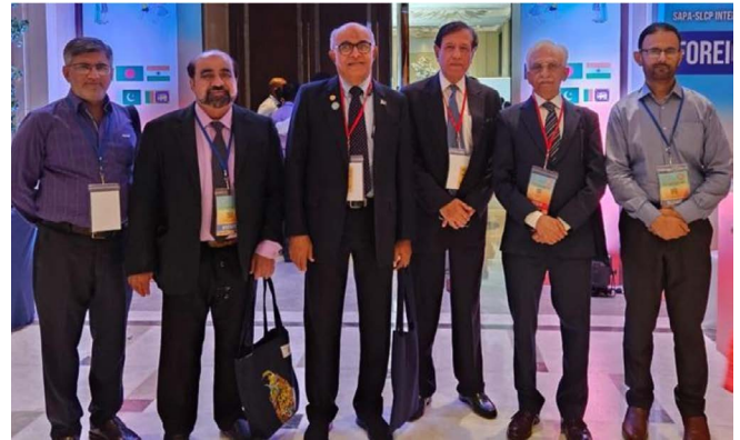
Foto de grupo