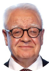
Enver Hasanoglu Turkey