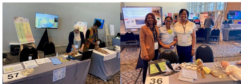
Gauche: Table du marché technique sur les Soins essentiels du nouveau-né; Droite: Table du marché technique sur les Soins Kangourou immédiats