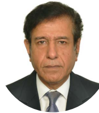
Rajeshwar Dayal India (ISTP)